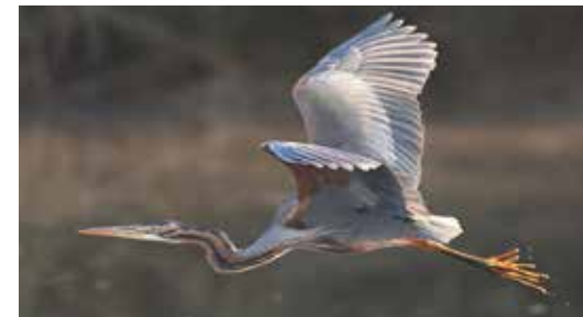
Purpurreiher ( Ardea purpurea )

Die im Eis des Gurgler Ferner auf 3.004 Metern gefundene Gletschermumie wurde mit modernen bildgebenden Methoden untersucht. Das AutorInnenteam rund um Johannes Pallua von der Universitätsklinik für Orthopädie und Traumatologie konnte u.a. zeigen, dass Mikro-CT und MRT Bildgebung in Kombination mit etablierten invasiven Techniken (C14-Datierung, DNA Analyse) die Identifizierung von Tierarten unterstützt. Der Fund wurde als ein rund 350 Jahre alter männlicher Purpurreiher ( Ardea purpurea ) identifiziert. Mithilfe dreidimensionaler Digitalisierung und interaktiver Visualisierung von Mikro-CT und MRT konnten auch digitale Autopsien durchgeführt und eine hochdetaillierte 3D-Rekonstruktion erstellt werden. Die Ergebnisse wurden in der Fachzeitschrift Biology publiziert.