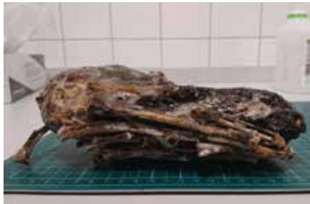
Probenentnahme auf der Gerichtsmedizin.