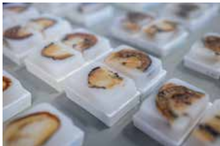
Paraffinblöcke nach makroskopischer Aufarbeitung.

Beschaffenheit. Ebenso wollte er nun mit dem Vogel verfahren.