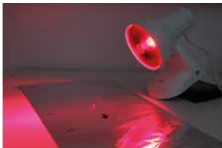
Für die C14-Datierung wird eine Probe getrocknet.